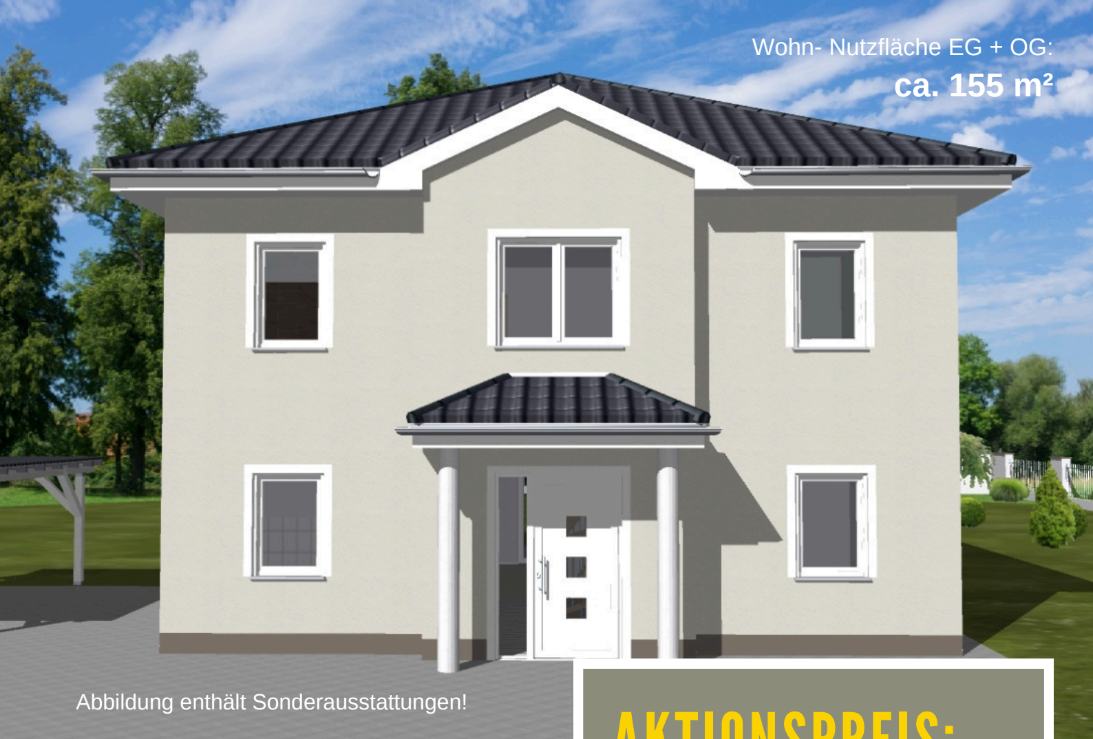
Abbildung enthält Sonderausstattungen!