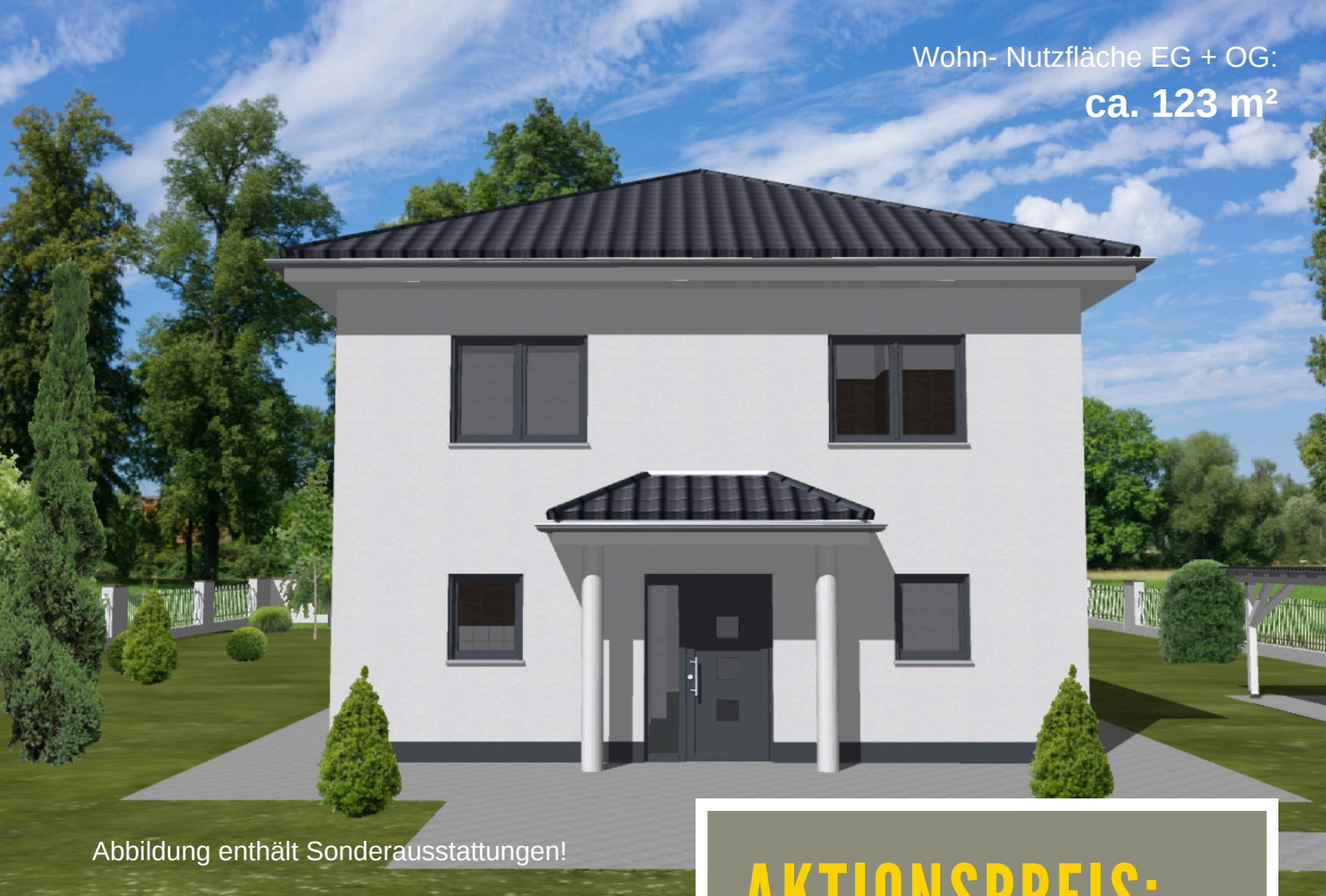
Abbildung enthält Sonderausstattungen!