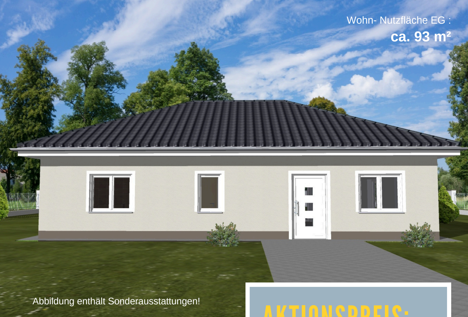
Abbildung enthält Sonderausstattungen!