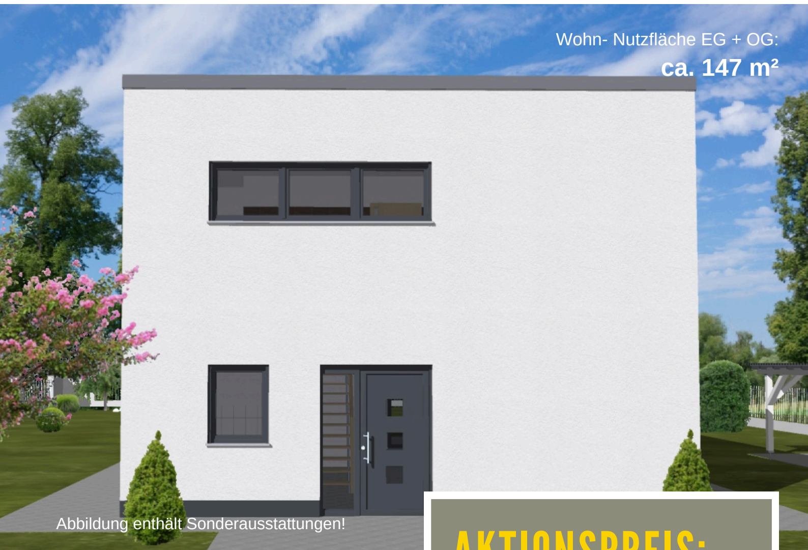
Abbildung enthält Sonderausstattungen!