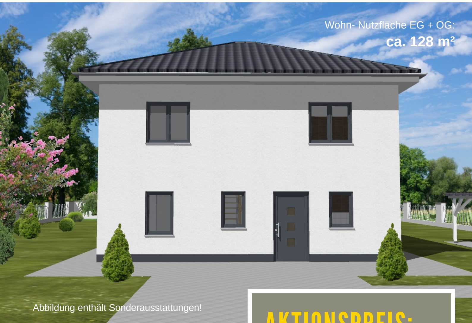
Abbildung enthält Sonderausstattungen!