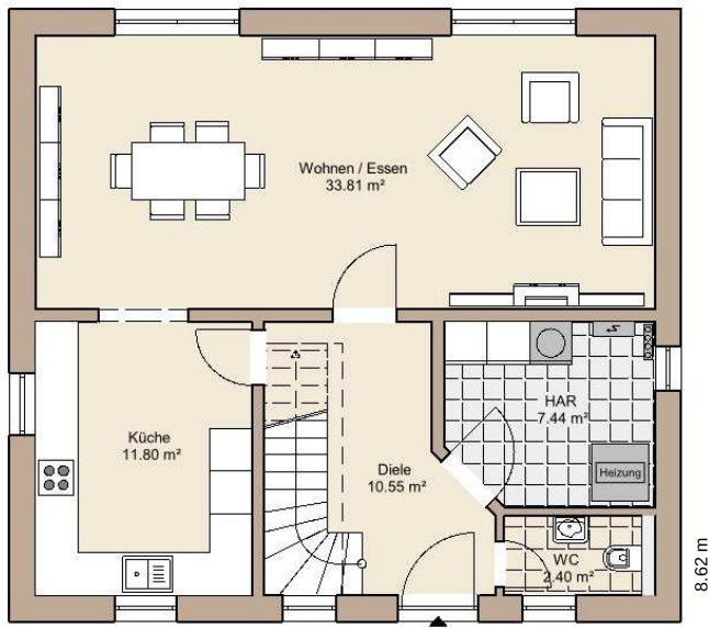
Erdgeschoss: Wohn- Nutzfläche ca. 66 m 2