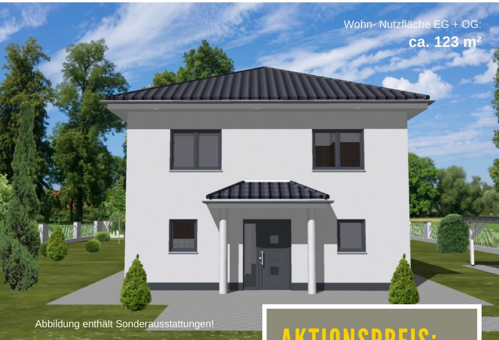
Abbildung enthält Sonderausstattungen!